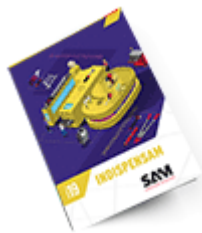
Les outils Indispensables 2019

Découvrez tous nos produits dans nos catalogues en ligne