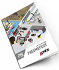
Pneumatique SAM 2019