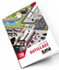
Outillage SAM 2019