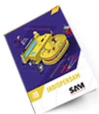
Les outils Indispensables SAM 2019

Découvrez tous nos produits dans nos catalogues en ligne