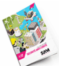
Sécurité anti-chute 2017