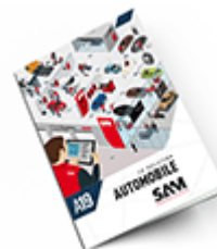
Automobile SAM 2019