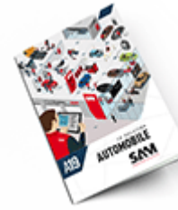
Automobile SAM 2019 Consulter le catalogue