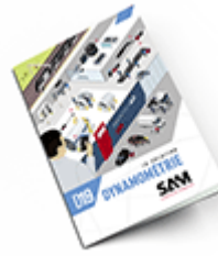
Dynamométrie SAM 2019 Consulter le catalogue