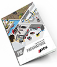
Pneumatique SAM 2019 Consulter le catalogue