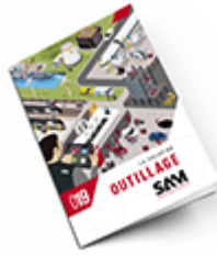
Outillage SAM 2019 Consulter le catalogue