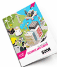
Sécurité anti-chute SAM 2017 Consulter le catalogue