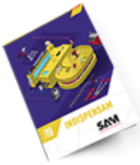
Les outils Indispensables SAM 2019 Consulter le catalogue