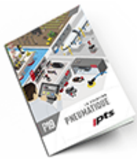
Pneumatique SAM 2019