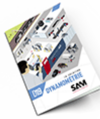
Dynamométrie SAM 2019