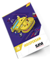
Les outils Indispensables SAM 2019