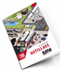
Outillage SAM 2019