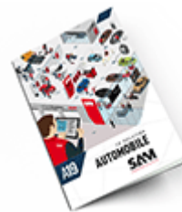
Automobile SAM 2019