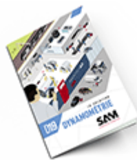
Dynamométrie SAM 2019