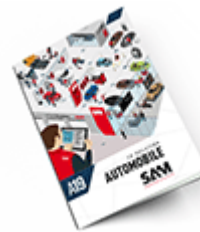
Automobile SAM 2019