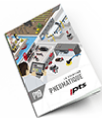
Pneumatique SAM 2019