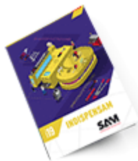
Les outils Indispensables SAM 2019

Découvrez tous nos produits dans nos catalogues en ligne