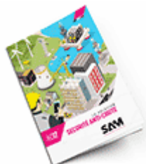
Sécurité anti-chute 2017