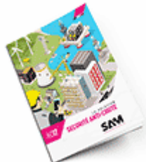
Sécurité anti-chute 2017