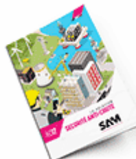
Sécurité anti-chute 2017