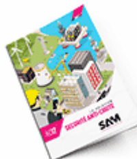
Sécurité anti-chute 2017