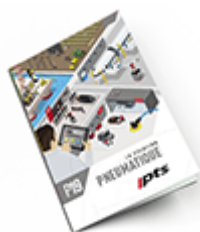
Pneumatique SAM 2019