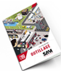
Outillage SAM 2019