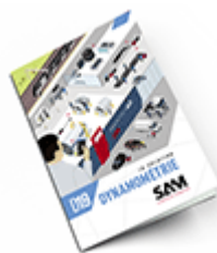
Dynamométrie SAM 2019