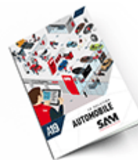
Automobile SAM 2019