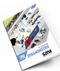
Dynamométrie SAM 2019