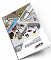
Pneumatique SAM 2019