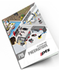
Pneumatique SAM 2019 Consulter le catalogue