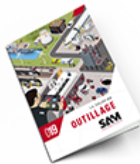
Outillage SAM 2019 Consulter le catalogue