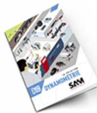
Dynamométrie SAM 2019 Consulter le catalogue