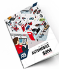
Automobile SAM 2019 Consulter le catalogue