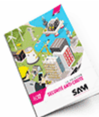
Sécurité anti-chute SAM 2017 Consulter le catalogue