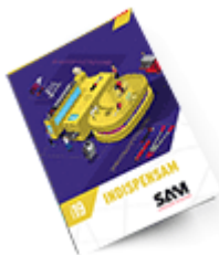
Les outils Indispensables SAM 2019 Consulter le catalogue

Découvrez tous nos produits dans nos catalogues en ligne