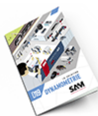
Dynamométrie SAM 2019