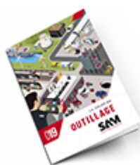
Outillage SAM 2019