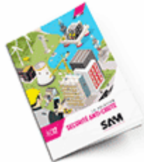
Sécurité anti-chute SAM 2017