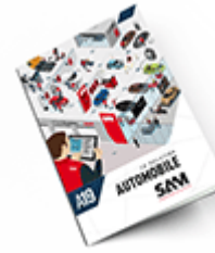
Automobile SAM 2019