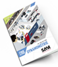
Dynamométrie SAM 2019