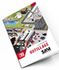
Outillage SAM 2019 Consulter le catalogue