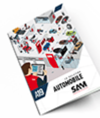
Automobile SAM 2019 Consulter le catalogue