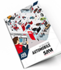
Automobile SAM 2019