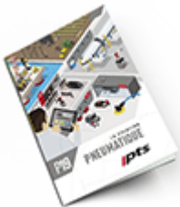
Pneumatique SAM 2019