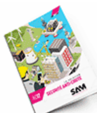
Sécurité anti-chute SAM 2017