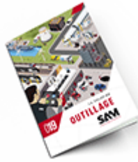
Outillage SAM 2019