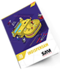
Les outils Indispensables SAM 2019

Découvrez tous nos produits dans nos catalogues en ligne