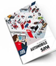
Automobile SAM 2019