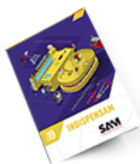
Les outils Indispensables 2019

Découvrez tous nos produits dans nos catalogues en ligne