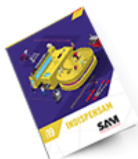
Les outils Indispensables SAM 2019