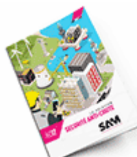
Sécurité anti-chute 2017