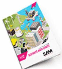
Sécurité anti-chute 2017