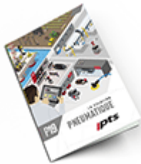
Pneumatique SAM 2019