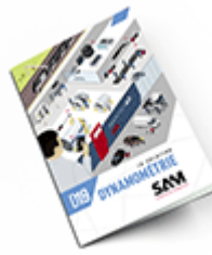
Dynamométrie SAM 2019