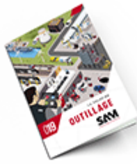
Outillage SAM 2019