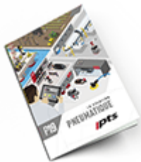
Pneumatique SAM 2019