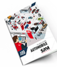
Automobile SAM 2019