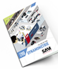
Dynamométrie SAM 2019