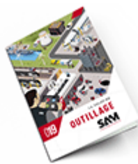
Outillage SAM 2019