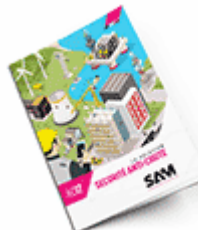
Sécurité anti-chute 2017