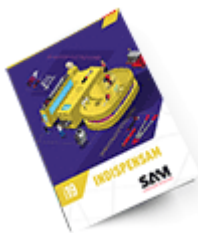
Les outils Indispensables SAM 2019