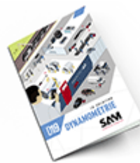
Dynamométrie SAM 2019