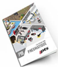
Pneumatique SAM 2019