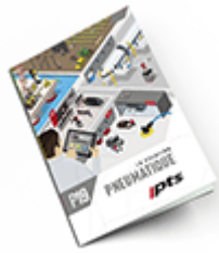
Pneumatique 2019 Consulter le catalogue