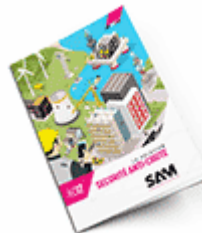
Sécurité anti-chute 2017 Consulter le catalogue