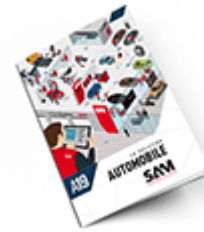
Automobile 2019 Consulter le catalogue