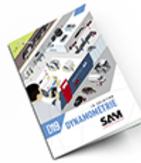
Dynamométrie 2019 Consulter le catalogue