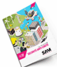
Sécurité anti-chute SAM 2017