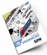
Dynamométrie SAM 2019