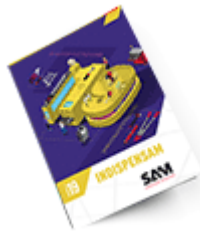
Les outils Indispensables SAM 2019