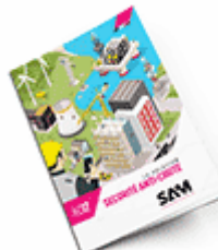
Sécurité anti-chute 2017