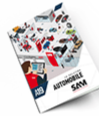
Automobile SAM 2019