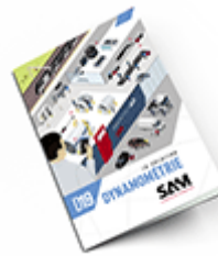
Dynamométrie SAM 2019