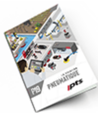
Pneumatique SAM 2019