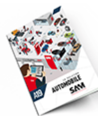
Automobile SAM 2019