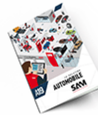
Automobile SAM 2019