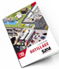
Outillage SAM 2019