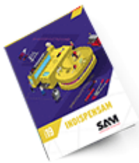
Les outils IndispensSAM 2019