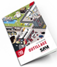
Outillage SAM 2019