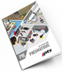
Pneumatique SAM 2019