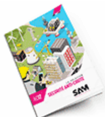
Sécurité anti-chute 2017