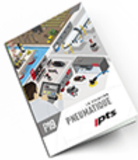
Pneumatique SAM 2019