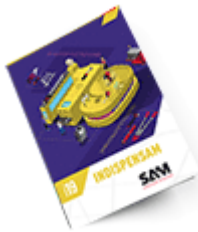
Les outils Indispensables SAM 2019

Découvrez tous nos produits dans nos catalogues en ligne