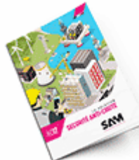
Sécurité anti-chute SAM 2017