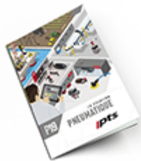
Pneumatique SAM 2019