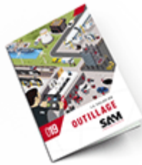
Outils SAM 2019