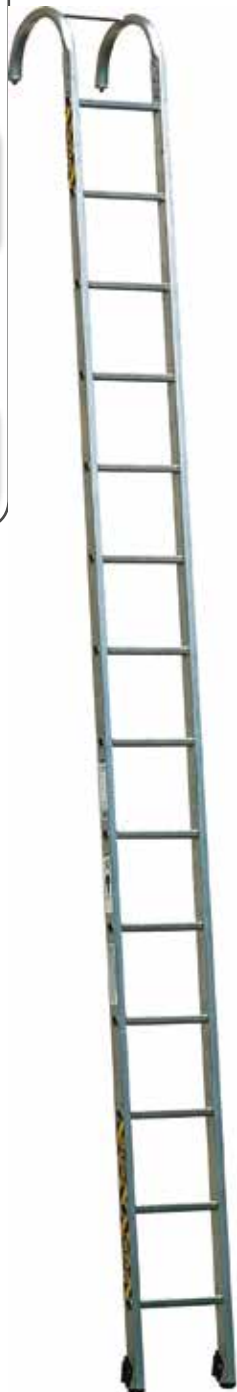
SCS 14 barreaux

NF Norme NF-EN 1147* Nit en vigueur. Garantie 5 ans.